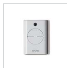
Pilot XT4 433 RC str. 102-103