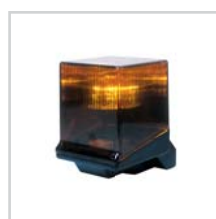
Lampa FAAC Light str. 106