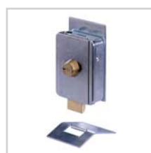
Elektrozamek str. 113