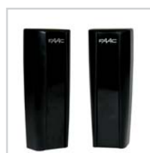
Fotokomórka Safebeam str. 107