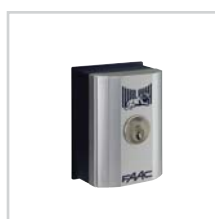
Wyłącznik kluczykowy str. 108