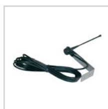
Antena str. 103